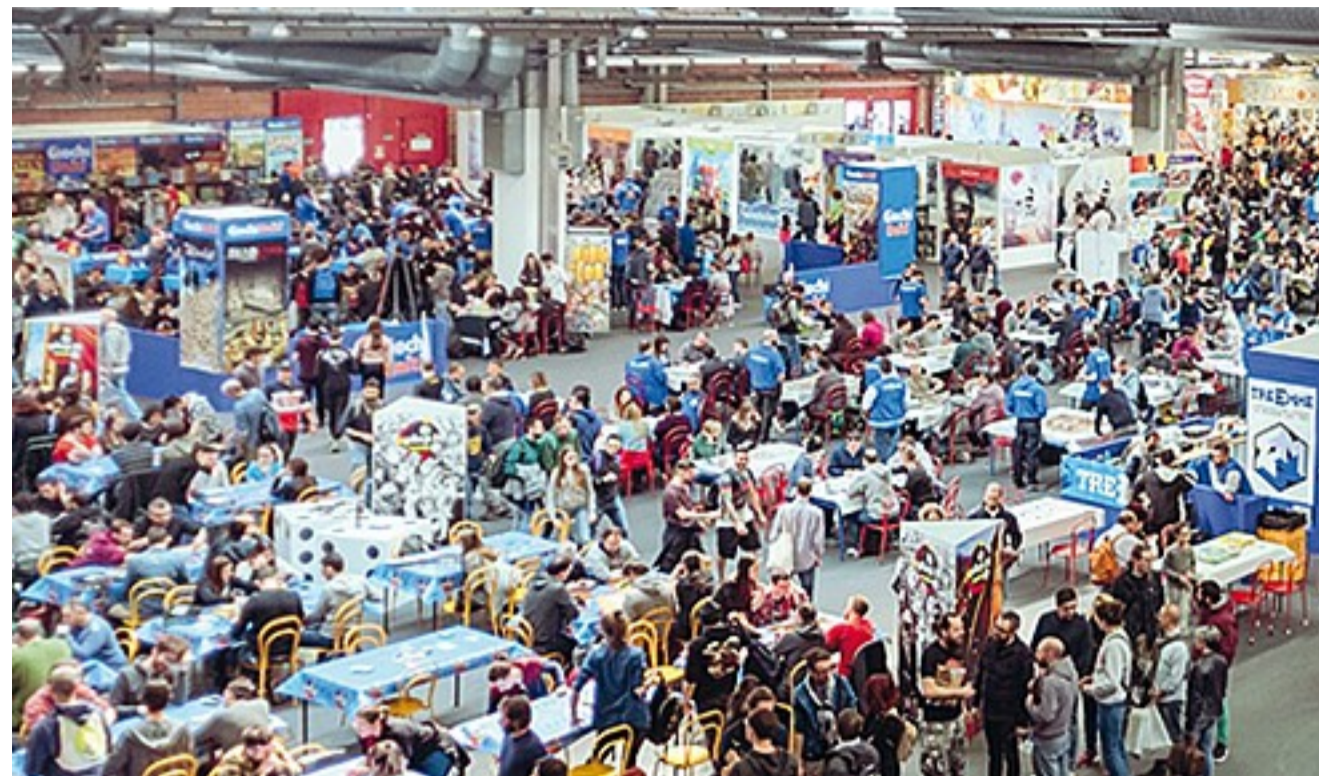
Ripartenza «Rivincita!» è il titolo scelto da «Play», il festival del gioco che torna nel Quartiere fieristico di Modena

Dante Alighieri, morto 700 anni fa in esilio, verrà ricordato dal gioco «The age of Dante: Montaperti e Campaldino», che rievoca lo scontro tra guelfi e ghibellini. Martin Lutero a 500 anni dalla scomunica è protagonista di «Here I stand», che permette di rivi-